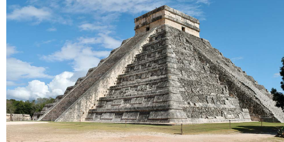
Auf der Segelreise haben Sie auch mal festen Boden unter den Füßen. In Mexiko zum Beispiel, wenn Sie die Pyramide des Kukulcán in der Ruinenstadt Chichén Itzá im Norden der Yucatán-Halbinsel bestaunen.