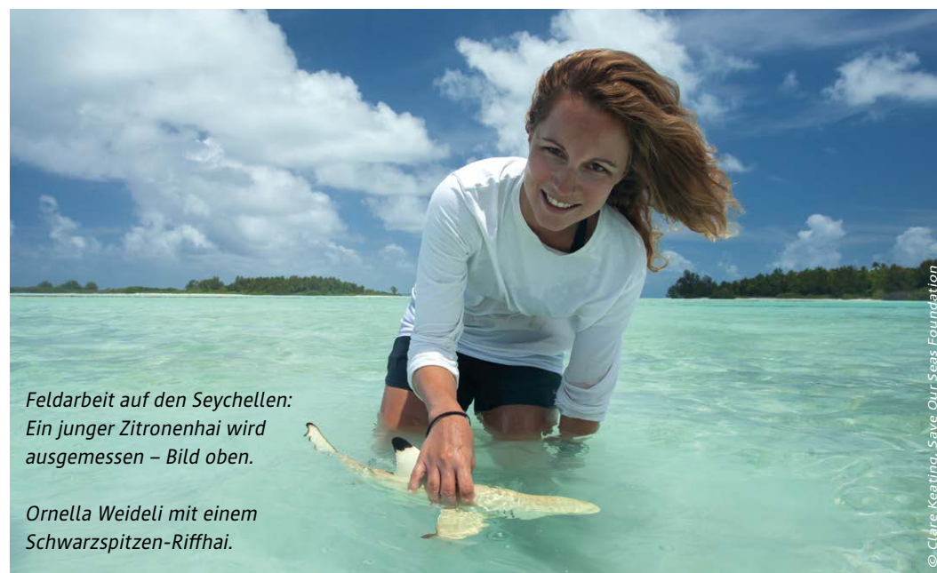
Feldarbeit auf den Seychellen: Ein junger Zitronenhai wird ausgemessen – Bild oben.